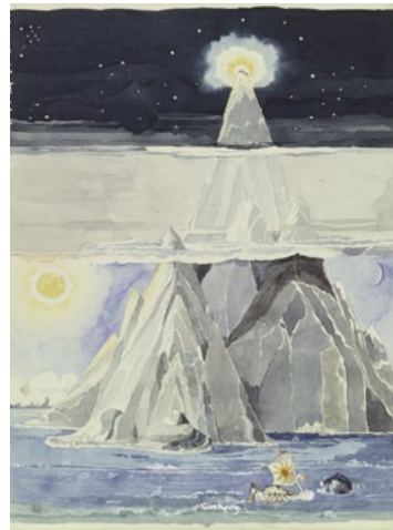
Halls of Manwë - Taniquetil , de J. R. R. Tolkien. © The Tolkien Trust 1973

C'est à présent à une montagne que s'attaque la Cité pour la deuxième tapisserie de la tenture Tolkien : Halls of Manwë , le sommet sacré du Taniquetil, la montagne la plus élevée de la mythologie de Tolkien, l'un des paysages décrits dans le Silmarillion . Les Ateliers Pinton à Felletin, lauréats de l'appel d'offres de tissage, débutent le montage de la chaîne : 1648 fils de chaîne à attacher un à un aux barres de lisses qui permettront de les écarter par fils pairs et impairs et ainsi laisser passer les flûtes des lissiers pendant le tissage. L'œuvre devrait être présentée à la Cité de la tapisserie à l'automne 2018.