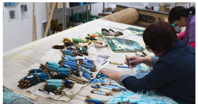
Tissage de la première tapisserie Tolkien en février 2018.

"Le fait que cette ancienne institution d'artisanat ait choisi de faire ce travail basé sur l'œuvre de Tolkien, c'est quelque chose qui me touche énormément. [...] C'est une adaptation qui met en valeur l'œuvre de