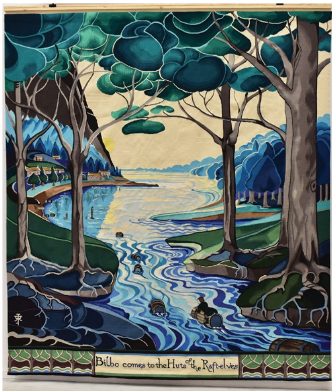
Bilbo comes to the Huts of the Raft-Elves , est la première adaptation tissée de l'œuvre graphique de J. R. R. Tolkien.

Après un passage en couture pour réaliser les ourlets, la tapisserie a pris sa place dans l'espace dédié à l'opération "Aubusson tisse Tolkien" au sein de la Cité internationale de la tapisserie. Elle y sera visible jusqu'au 31 décembre 2018. Deux autres pièces devaient la rejoindre d'ici la fin de l'automne 2018.