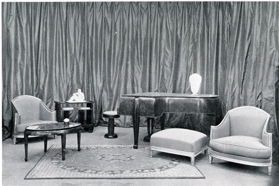
Stand de la Compagnie des arts français, Louis Süe et André Mare, Salon d'Automne 1921