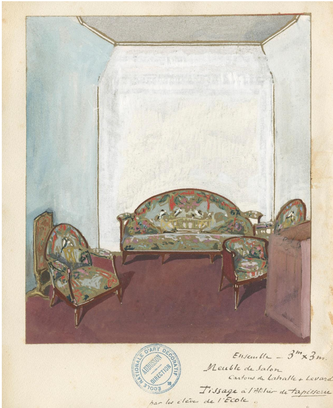
Projet pour un salon, Pierre Lahalle