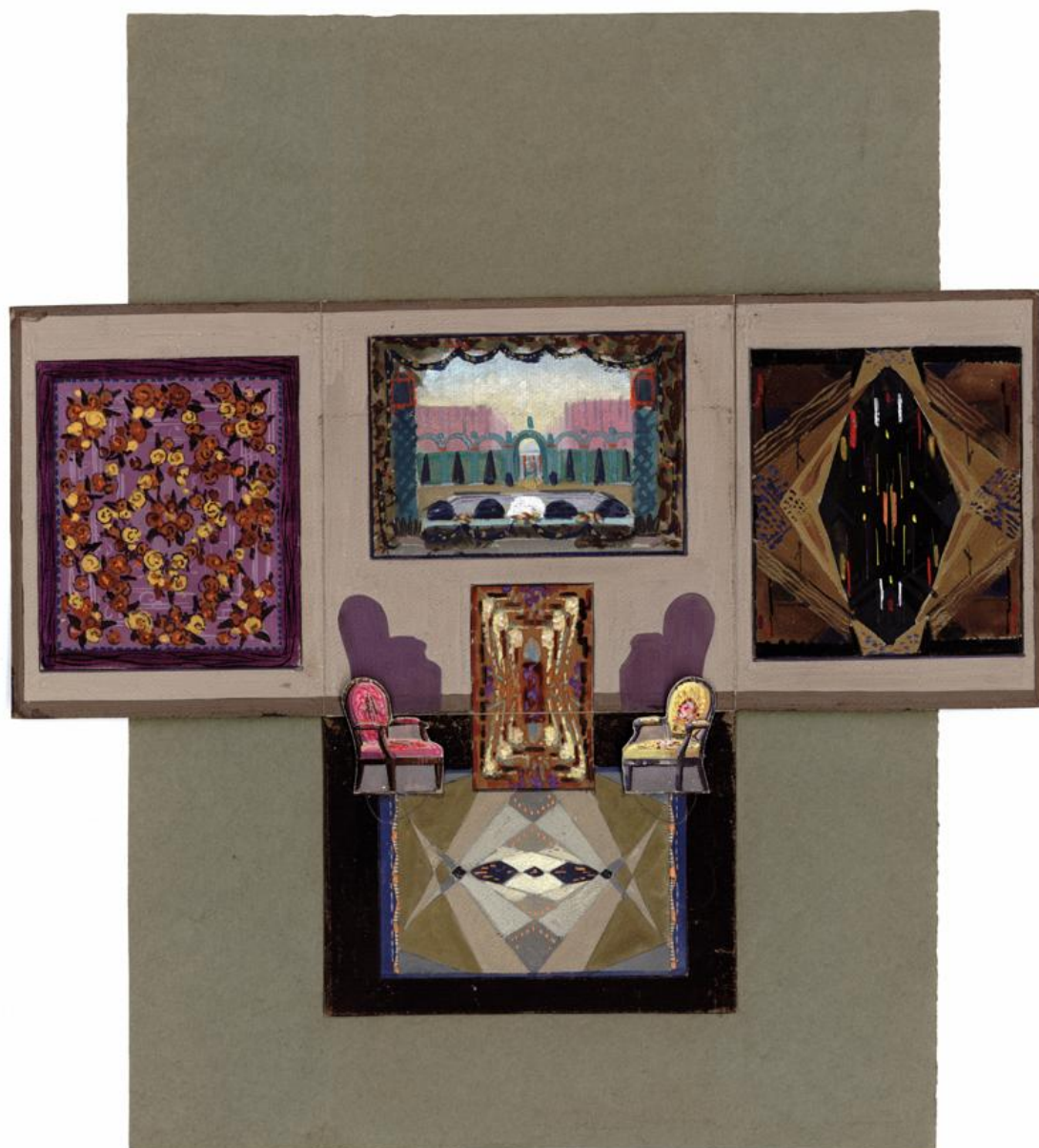
Maquette du stand de la Manufacture Coupé de Bourganeuf à l'Exposition internationale de 1925