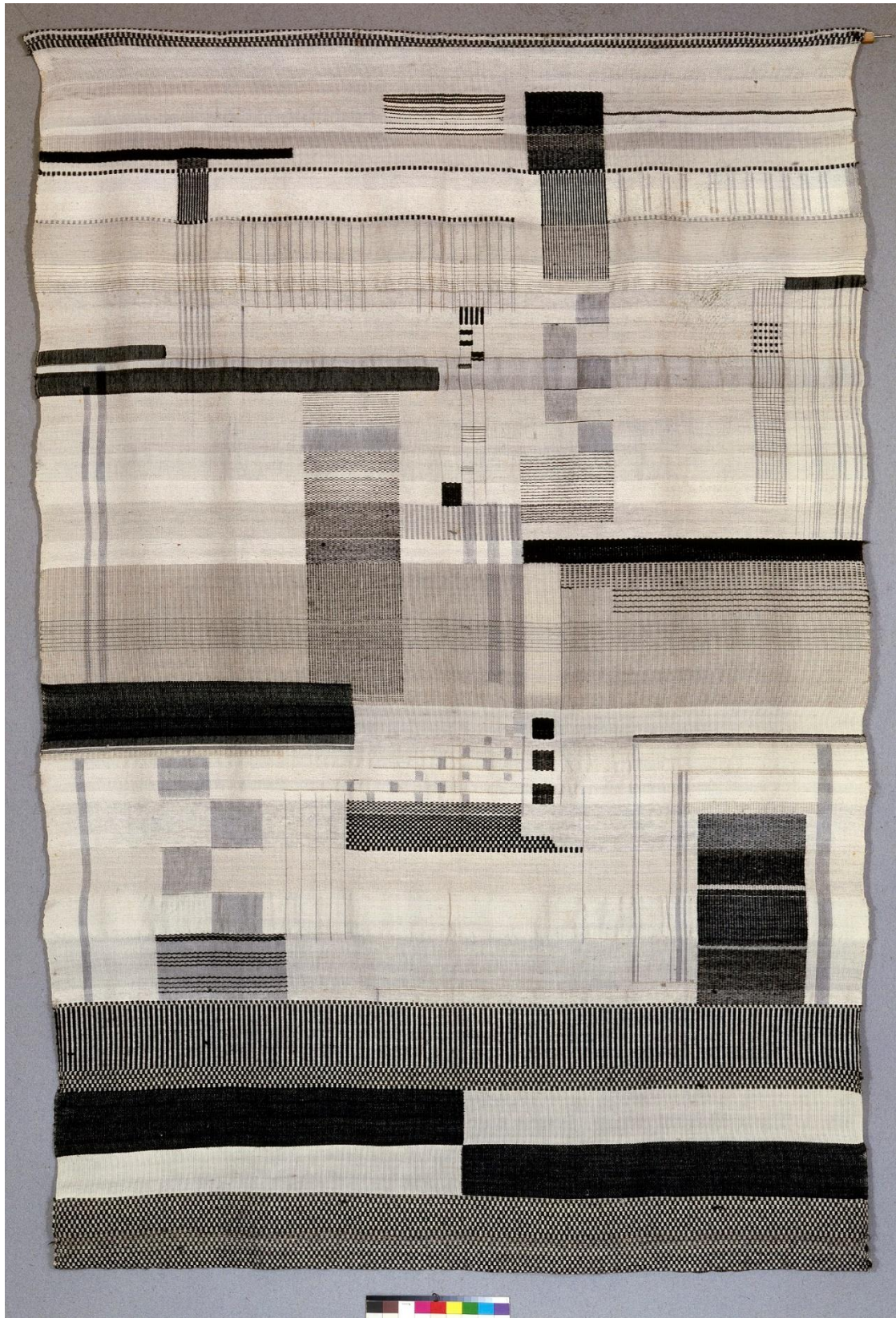
Noir et blanc , Güntra Stölzl, 1923-24, Kunstsammlungen zu Weimar