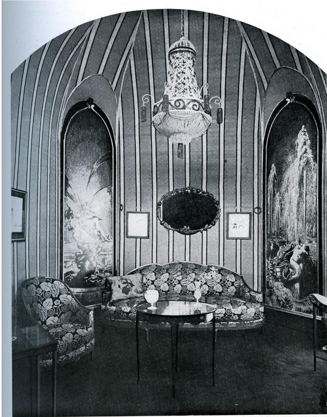
Boudoir par Louis Süe et J. Palyart au Salon d'Automne 1913, canapé et fauteuils de Louis Süe