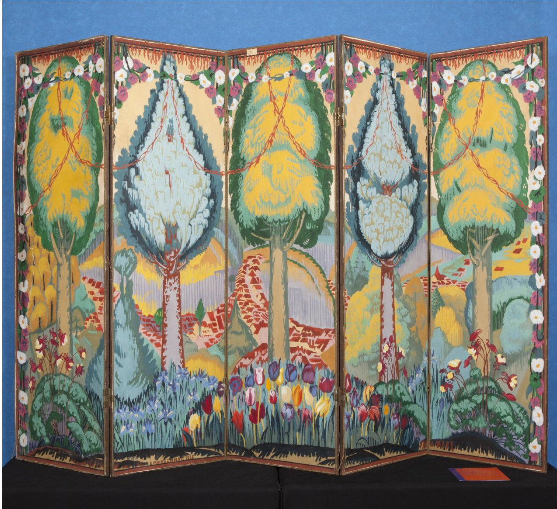
Maquette pour un paravent en tapisserie, Elie Maingonnat, Cité internationale de la tapisserie